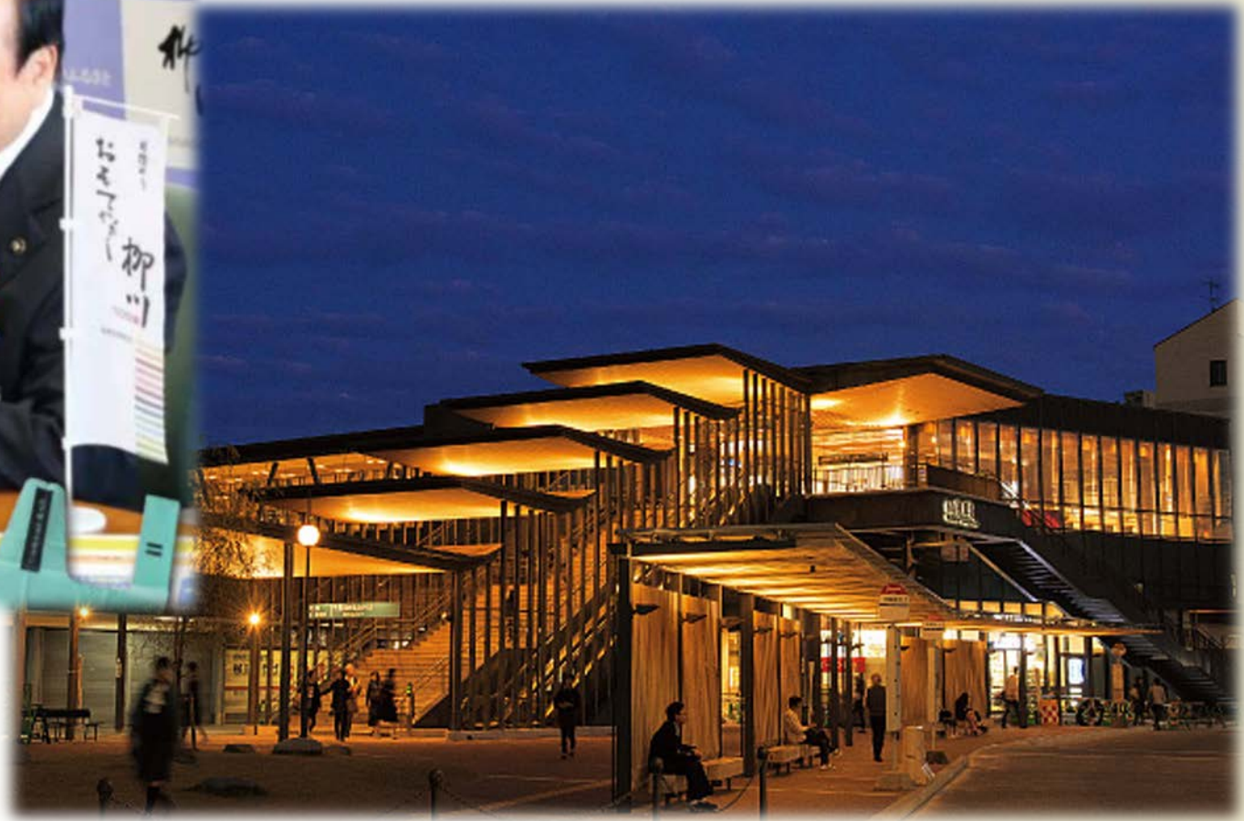
西鉄柳川駅が オシャレ