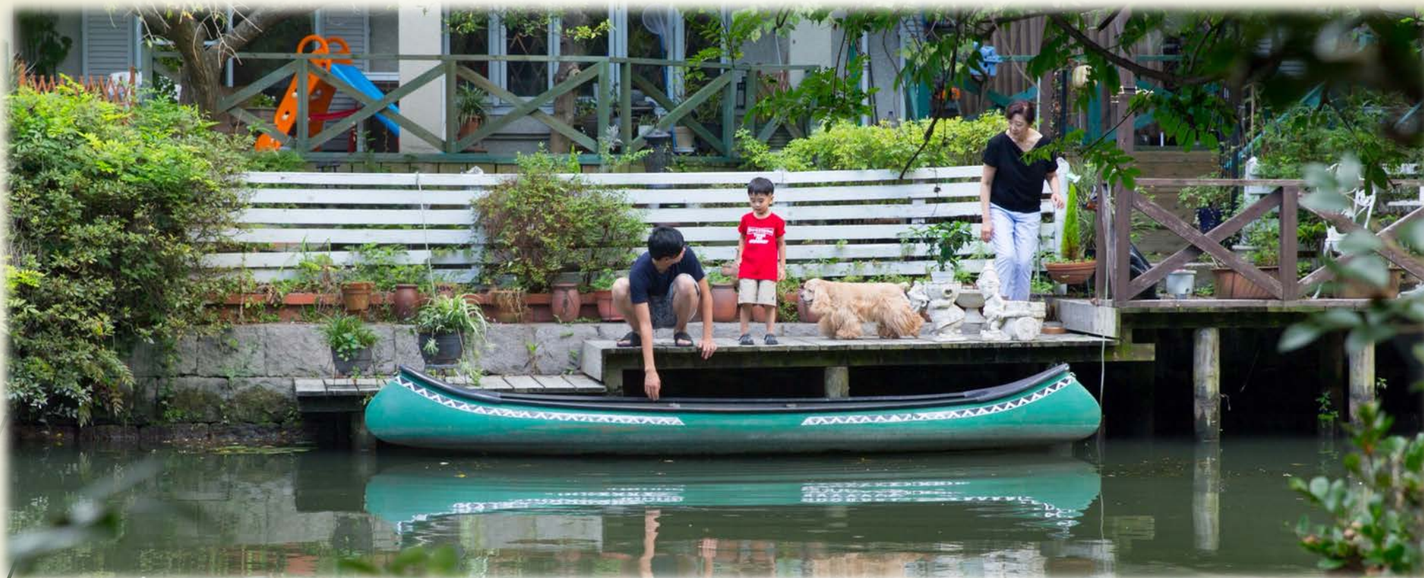
柳川市の紹介 (写真掲載 柳川市HPより)